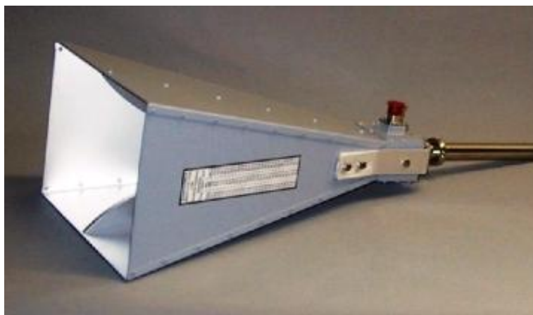
Рисунок 8 – Внешний вид рупора ВВНА 9120 LF