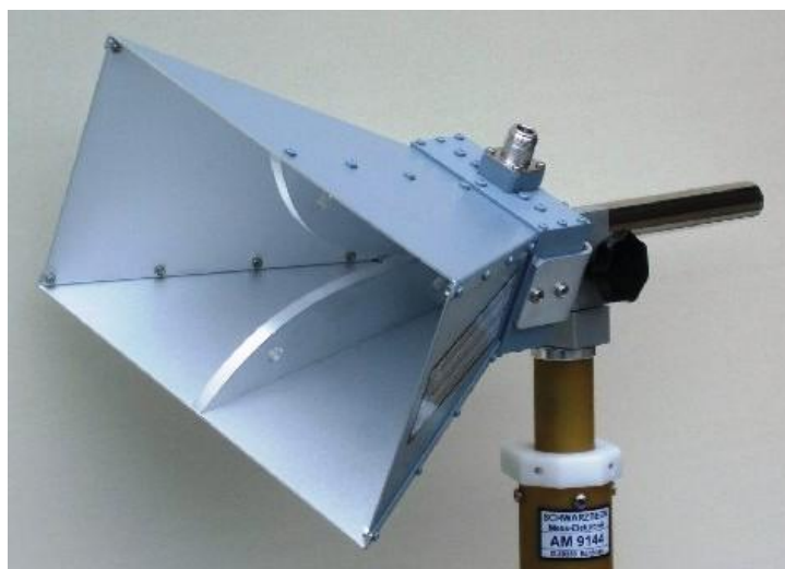
Рисунок 4 – Внешний вид рупора ВВНА 9120 D