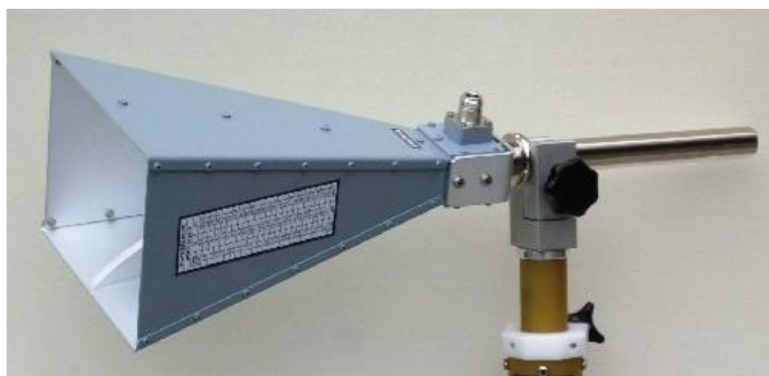
Рисунок 2 – Внешний вид рупора ВВНА 9120 В