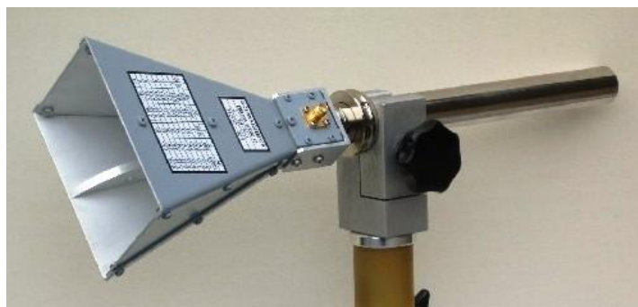
Рисунок 3 – Внешний вид рупора ВВНА 9120 С