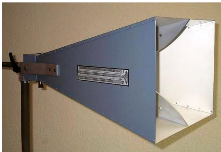
Рисунок 5 – Внешний вид рупора ВВНА 9120 Е