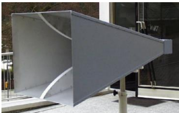
Рисунок 7 – Внешний вид рупора ВВНА 9120 G