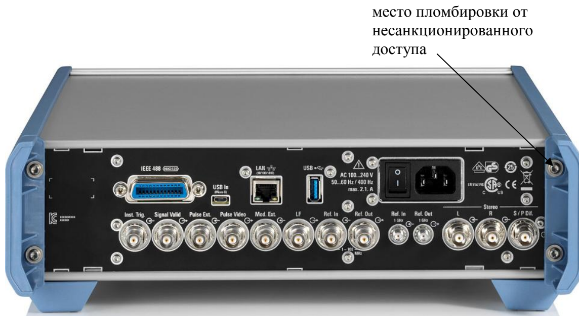
Рисунок 1 - Общий вид средства измерений

место пломбировки от несанкционированного доступа