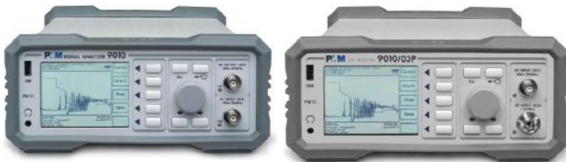
Рис. 1а Внешний вид приемника РММ 9010 (слева) и РММ 9010/03P (справа)

Схема пломбировки от несанкционированного доступа и обозначение мест для размещения наклейки приведены на рисунке 2.