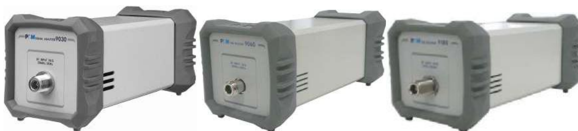
Рис. 1в Внешний вид модулей расширения PMM 9030 (слева), PMM 9060 (центр), PMM 9180 (справа)