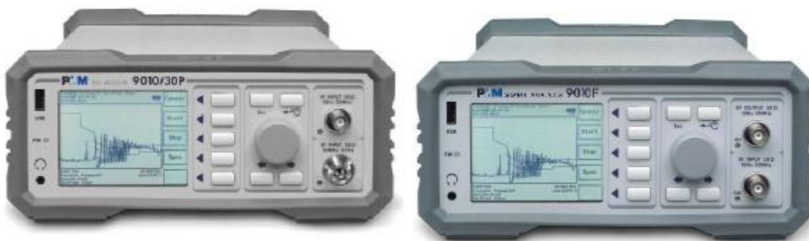
Рис. 1б Внешний вид приемника PMM 9010/30P (слева) и PMM 9010F (справа)